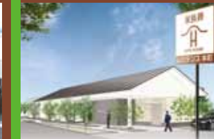
ゲートハウス レジデンス本町 〒640-8024 和歌山市元寺町1丁目5