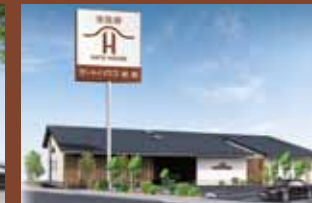
ゲートハウス 狐島 〒640-8412 和歌山市狐島3-1