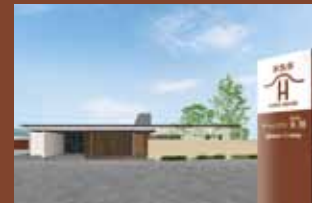
ゲートハウス 宮街道 太田 〒640-8323 和歌山市太田4丁目1-1