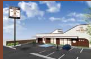
ゲートハウス 黒田 〒640-8341 和歌山市黒田259-1