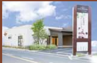
ゲートハウス 松江西 〒640-8435 和歌山市古屋213-1